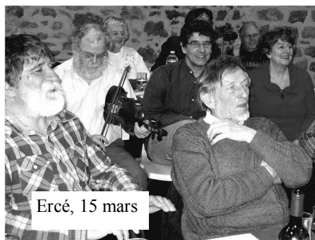
Ercé, 15 mars