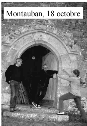
Montauban, 18 octobre