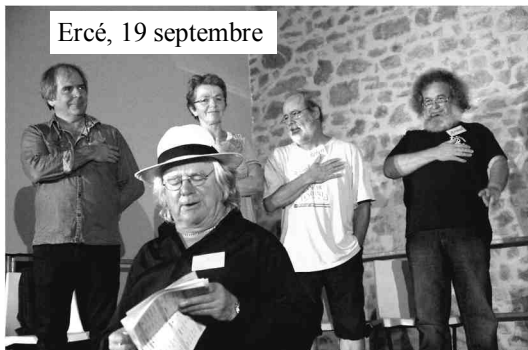
Ercé, 19 septembre