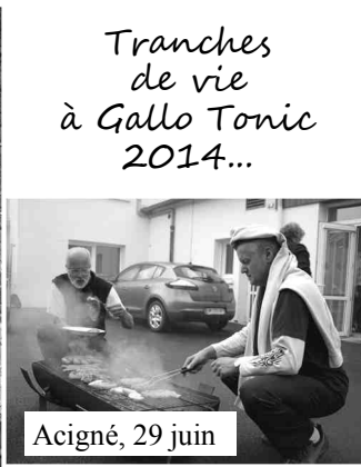
Acigné, 29 juin