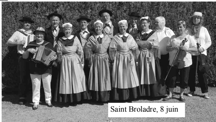
Saint Broladre, 8 juin