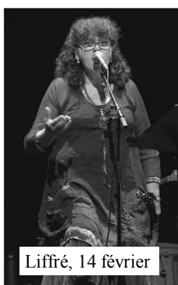
Liffré, 14 février