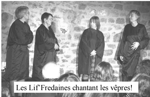
Les Lif Fredaines chantant les vèpres!