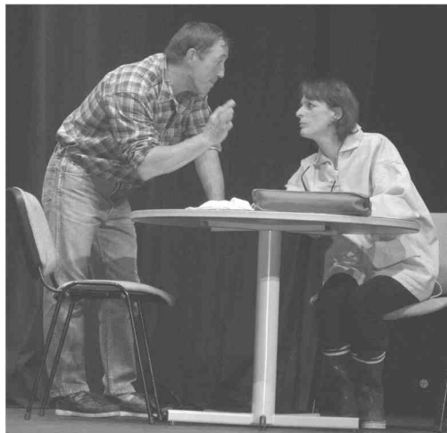
« Tradior en pleine action... »