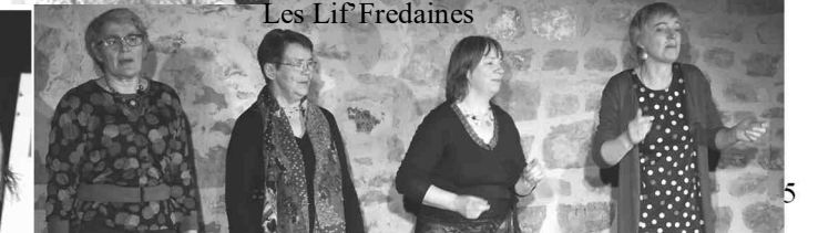
Les Lif Fredaines