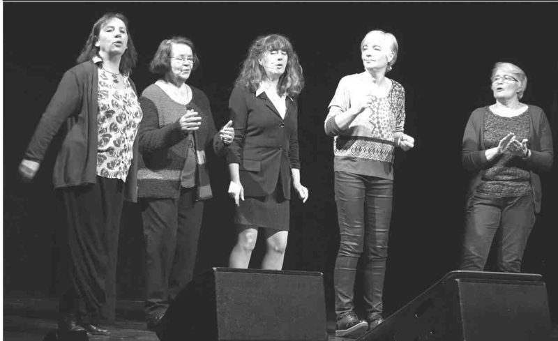
Les Lif Fredaines, des femmes qui évoquent avec finesse la condition féminine à travers des chants de tradition.

Le quartet Dour/Le Pottier: une grande diversité de sonorités par quatre virtuoses.