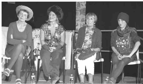
L'équipe « des filles » avait fait des frais de toilette!