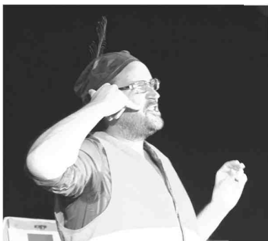
La récente actualité judiciaire a inspiré Matao...