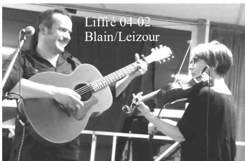
Liffré 04-02 Blain/Leizour