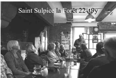
Saint Sulpice la Forêt 22-09y