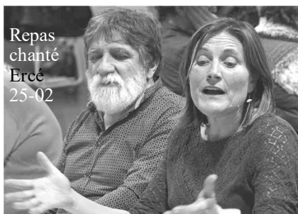
Repas chanté Ercé 25-02