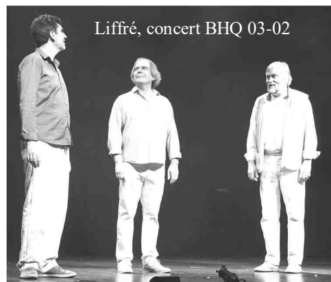
Liffré, concert BHQ 03-02