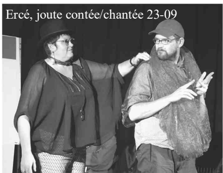
Ercé, joute contée/chantée 23-09